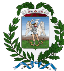
Provincia di Foggia