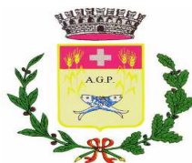
COMUNE DI LESINA Provincia di Foggia