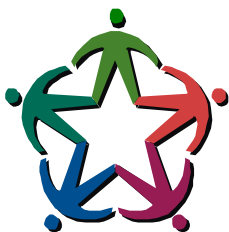
Servizio Civile Nazionale